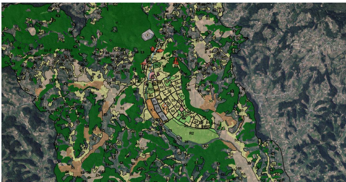
Izvod iz kartografskog prikaza 1.1. Namjena prostora